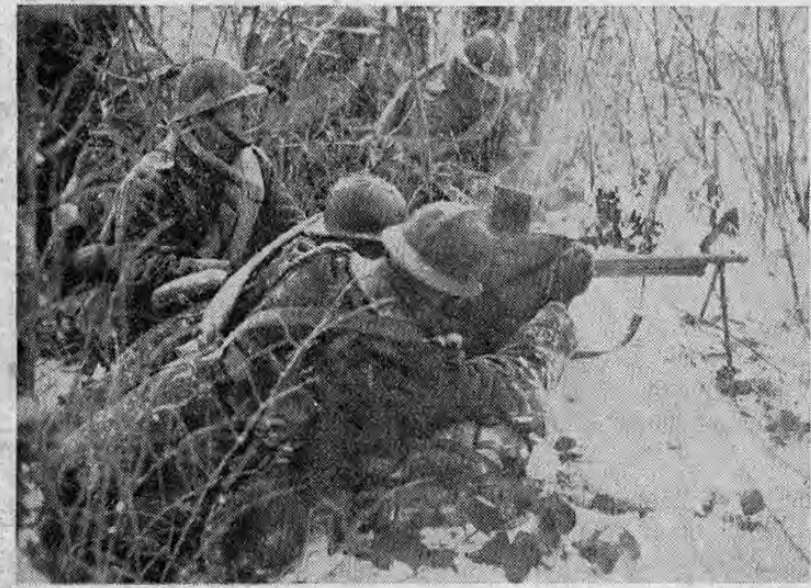
LOS POILUS DEFIENDEN SUS POSICIONES AVANZADAS EN EL FRENTE DEL LAUTER. La alerta ha sido dada; una patrulla enemiga avanza por el bosque cubierto de nieve y los poilus, desde un puesto avanzado rompen el fuego contra los prusianos que avanzan; esta escena muestra a un grupo de soldados tirando con un fusil ametralladora; el campo está cubierto de nieve que se nota también en la manga del grueso capote de invierno del primer soldado.

En alta mar se efectuará la entrevista del Presidente Roosevelt con personajes aliados